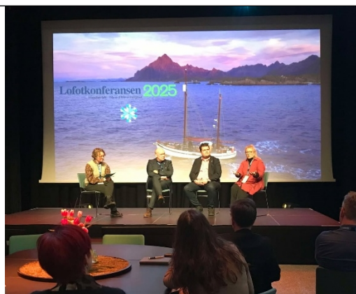
Meit under sin presentation och i paneldiskussion.

Vi kunde skriva under på många liknande utmaningar, inte minst komplexiteten i att erbjuda väl utbyggd kollektivtrafik med ett mindre resandeunderlag.